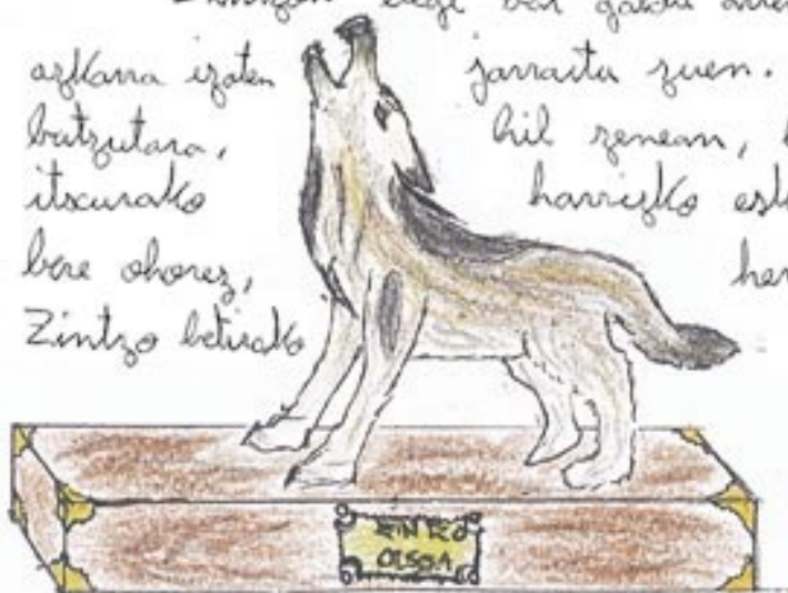
EGILEA: Aitor Omeñakano HARRAZKILARIAN Zuzen Lurra

Zintzok begi bat galdu zuen, beti bezain leiala eta azkara izaten batzutarra, itxurako bere ohorez, Zintzo betirako jarraitu zuen. Horregaitik, handik urte hil zenean, herriko plazan oro harriko eskultura bat eraili zuten herrikoen inmemorian bizirik egon zedin.