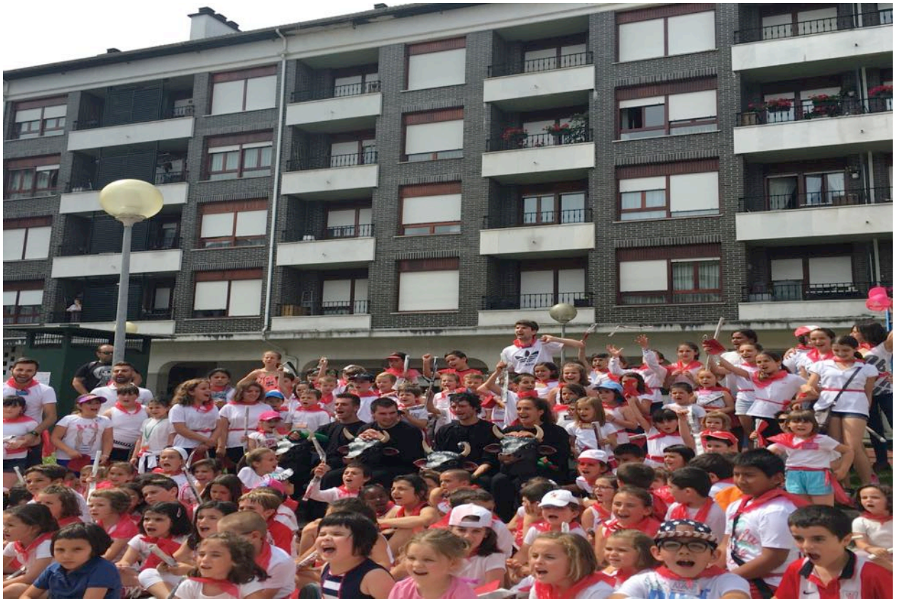
Oharra: Txosten honetako argazkiak “ASTEBURUETAKO AISIALDIA” txostenerako baino ez dira erabiliko.