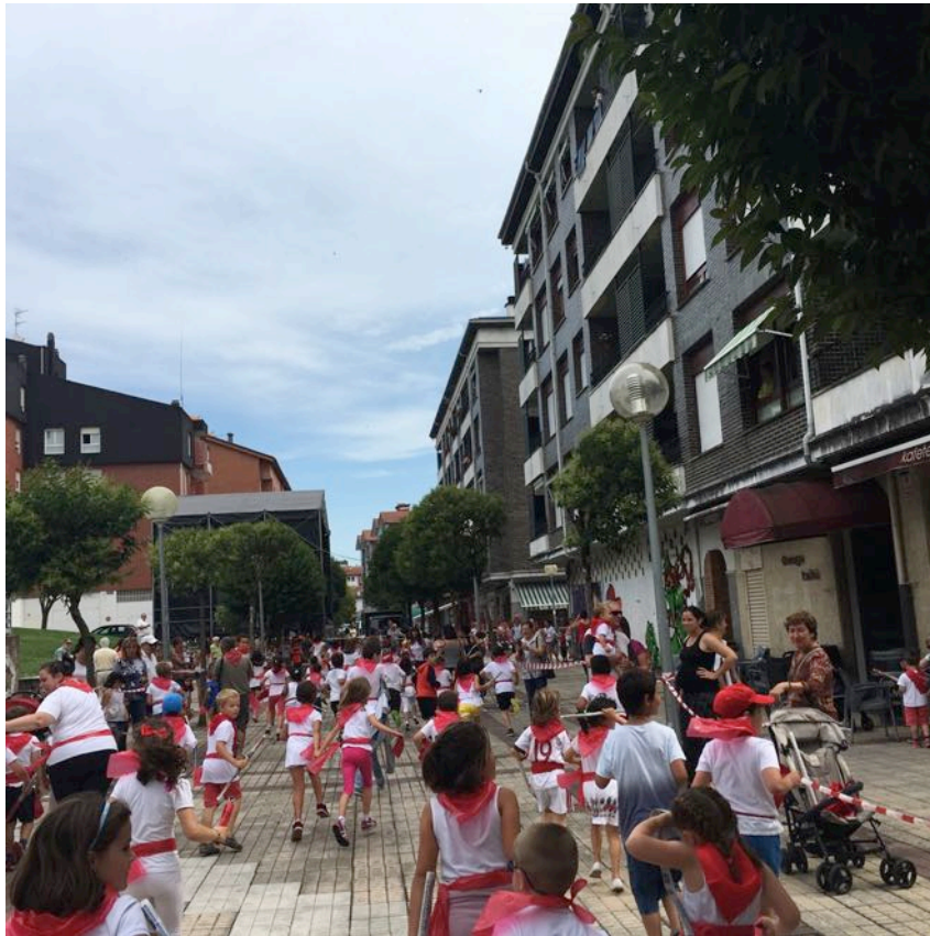
Oharra: Txosten honetako argazkiak “ASTEBURUETAKO AISIALDIA” txostenerako baino ez dira erabiliko.