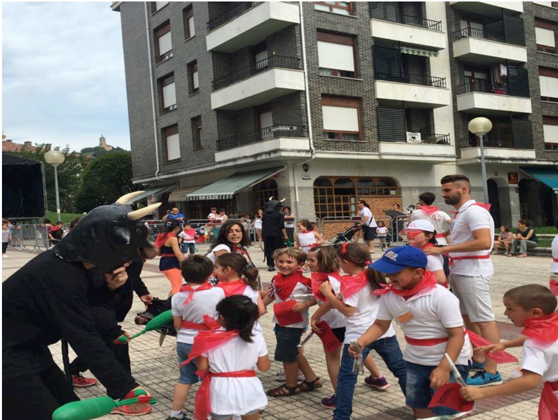
Oharra: Txosten honetako argazkiak “ASTEBURUETAKO AISIALDIA” txostenerako baino ez dira erabiliko.