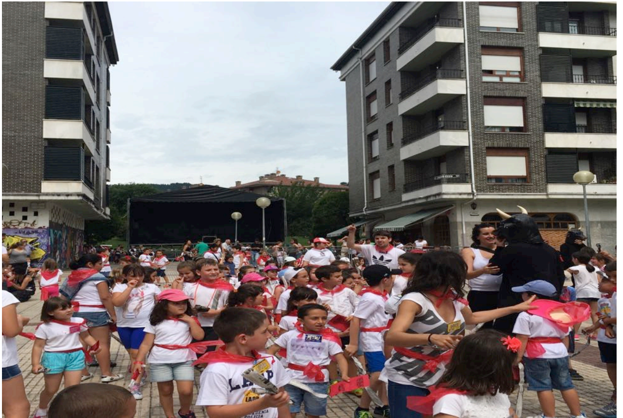
Oharra: Txosten honetako argazkiak “ASTE BURUETAKO AISIALDIA” txostenerako baino ez dira erabiliko.