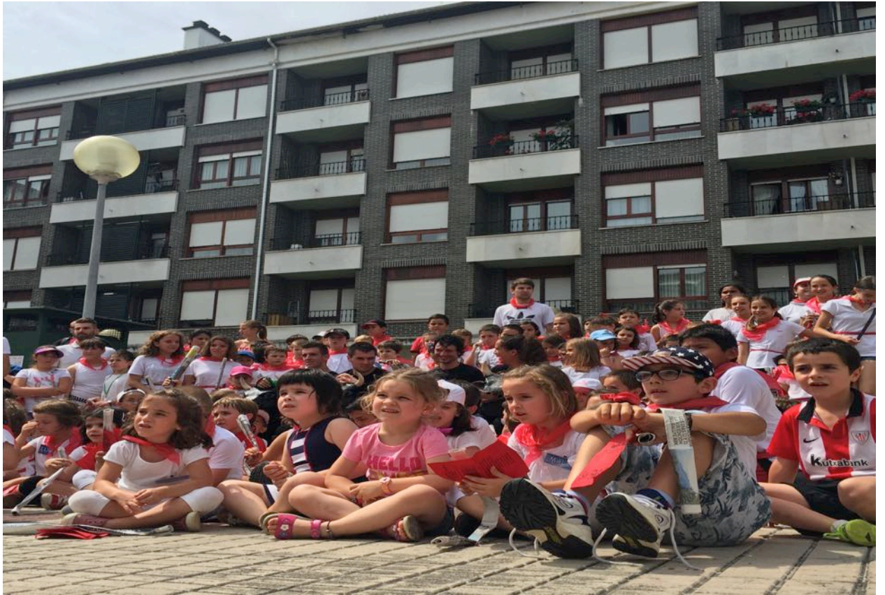
Oharra: Txosten honetako argazkiak “ASTEBURUETAKO AISIALDIA” txostenerako baino ez dira erabiliko.