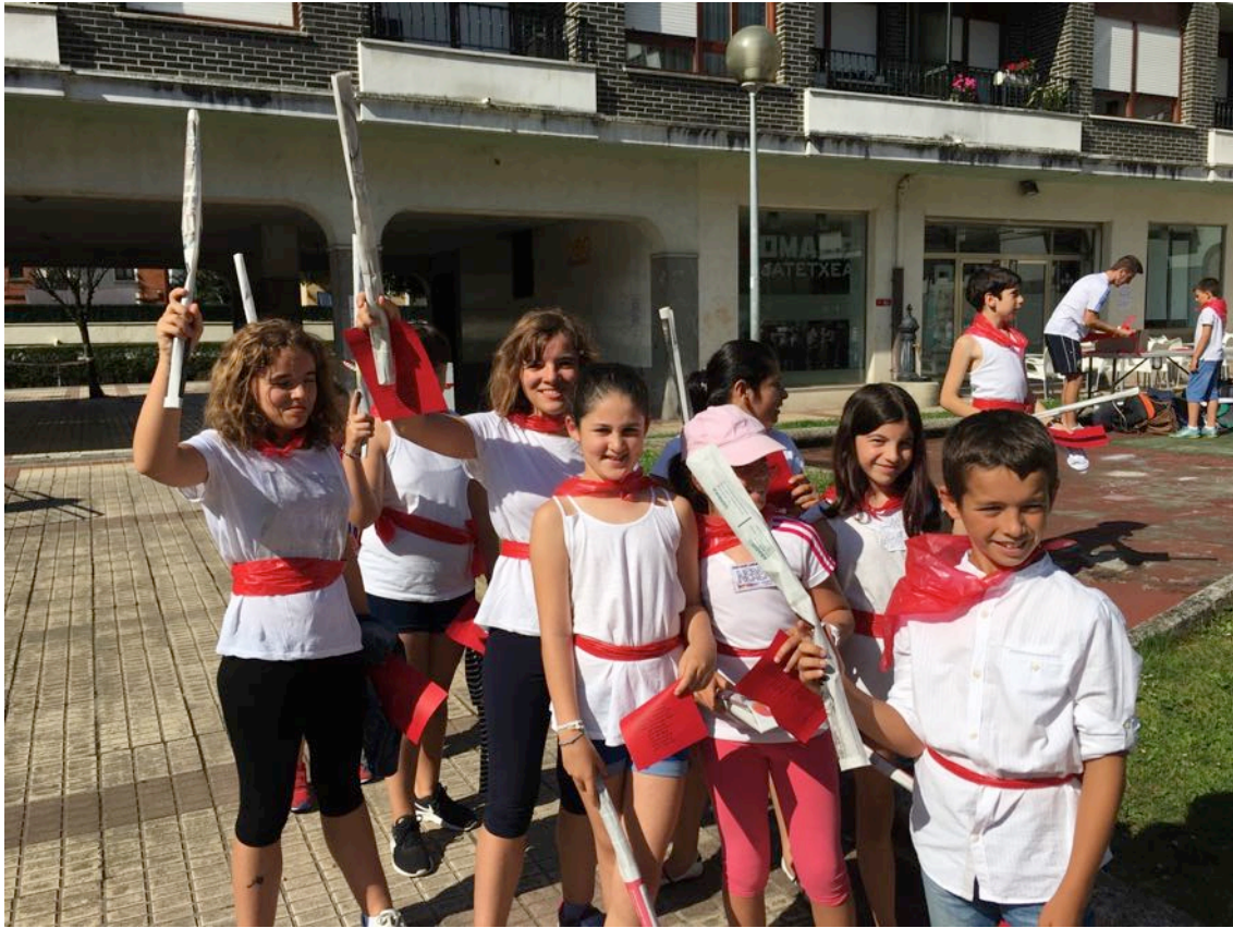
Oharra: Txosten honetako argazkiak “ASTEBURUETAKO AISIALDIA” txostenerako baino ez dira erabiliko.